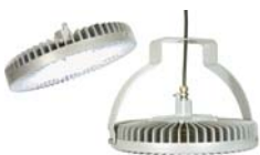
DuroSite® LED High Bay