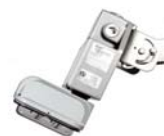
DuroSite® LED Area Light