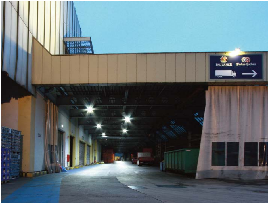
Paulaner verbessert die Lichtqualität und die Sicherheit mit Dialight LED-Leuchten der DuroSite® Serie

Alles in allem ist man bei Paulaner sehr zufrieden mit der neuen LED-Beleuchtung und auch mit der Zusammenarbeit mit Dialight. Harald Zeiller: „Von der Bemusterung bis zur Lieferung ging alles schnell und reibungslos über die Bühne, und wenn die Qualität weiterhin das hält, was Dialight verspricht, besteht durchaus die Möglichkeit für weitere Installationen.“